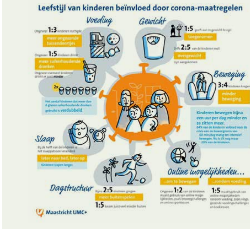
Figuur 1 Infographic COLC-studie, 1-meting medio 2021

wetenschappelijk aangetoond: kinderen die het traject doorlopen, leven gezonder en zijn gelukkiger. Inmiddels is het programma ook succesvol geïmplementeerd in de wijk, onder de naam Your Coach Next Door. Kind en gezin worden in contact gebracht met een coach dichtbij huis. Een coach die belemmerende en bevorderende factoren voor een gezonde leefstijl herkent, gezinnen motiveert om kleine stappen te maken om gezonder te leven en zo nodig effectief helpt naar een passend aanbod vanuit een lokaal netwerk. De eerste pilot in Maastricht toont enthousiasme bij kinderen, ouders, professionals en vooral keiharde cijfers die laten zien dat het kinderen lukt een gezonder gewicht te bereiken."